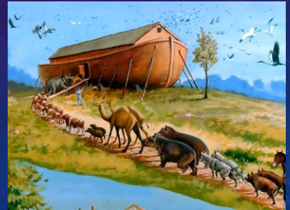
创7:15 凡有血肉、有气息的活物，都一对一对的到挪亚那里，进入方舟。